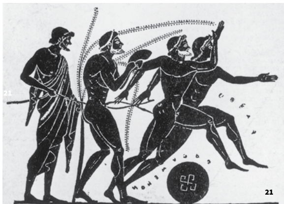
21. Le sport, une pratique culturelle de plusieurs siècles 22. Art textile et sport : terrain de création 23. La course à la montagne, de la distraction touristique à la tradition montagnarde