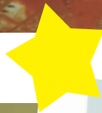
Préparation des masques de Carnaval