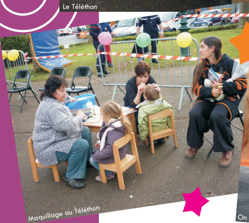
Maquillage au Téléthon