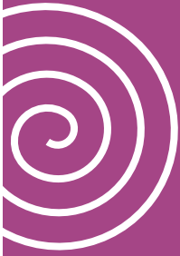
Jouons avec la terre