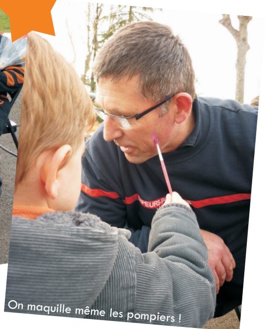
On maquille même les pompiers !