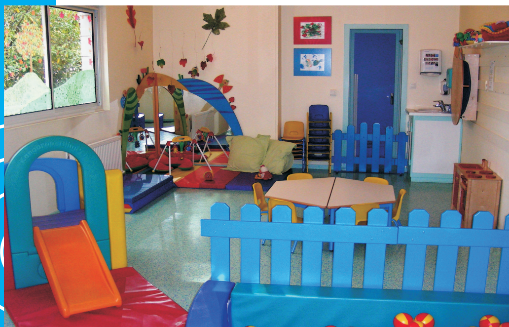
La salle du R.A.M.

La ville de Billère étant sur deux niveaux, et la plupart des assistantes maternelles n'ayant pas de voiture, la mairie met à la disposition du RAM un minibus de 9 places équipé de sièges auto. Avant chaque atelier, l'animatrice passe chercher les AM qui en font la demande et les raccompagne à leur domicile en fin d'atelier.